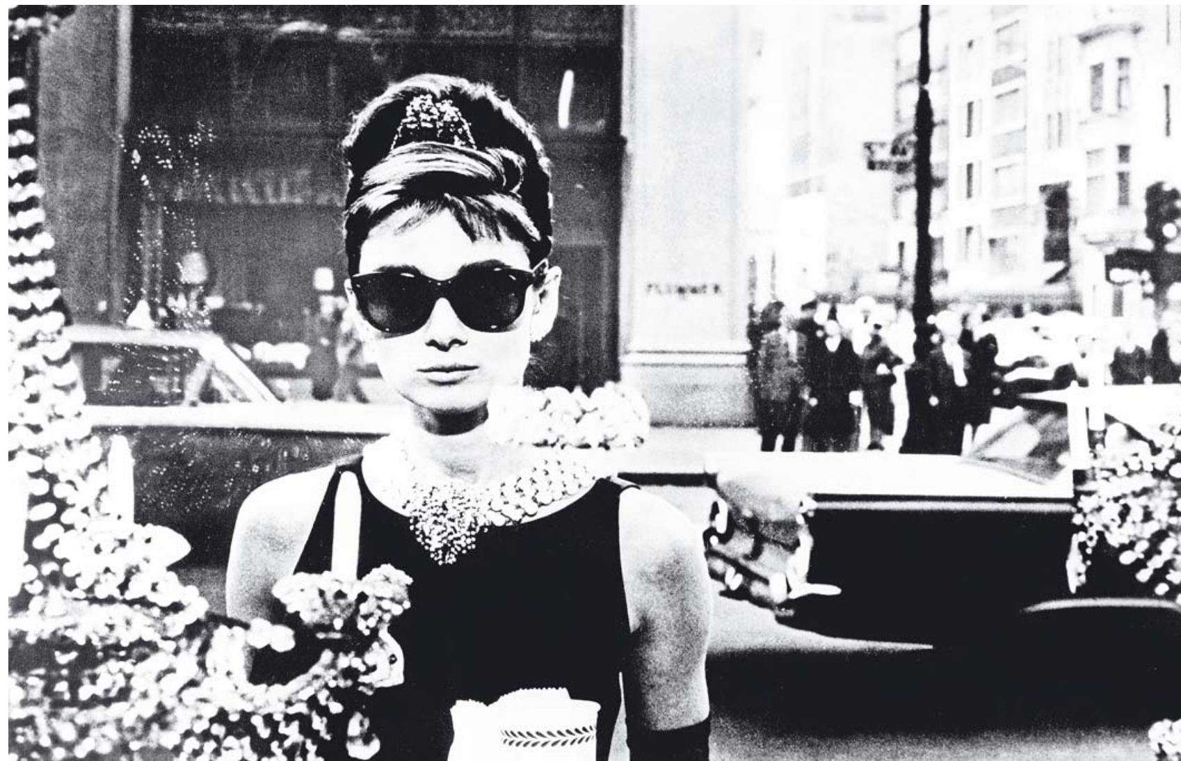
Audrey Hepburn im Film „Frühstück bei Tiffany“: Den Kult in die Gegenwart gerettet.