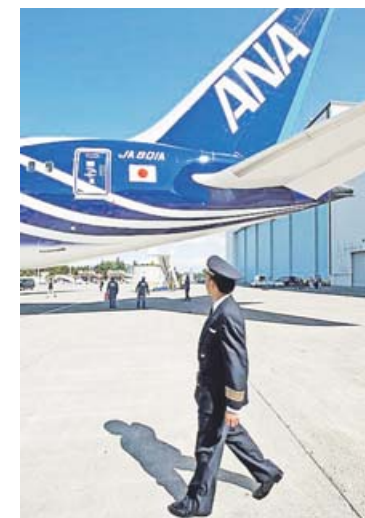
Ein Dreamliner von Ana: Bislang hat die Gesellschaft das lokale Geschäft vernachlässigt.

Der Flugverkehr in Asien und Ozeanien soll nach Branchenschätzungen in den kommenden 20 Jahren um mehr als sechs Prozent jährlich wachsen. Allerdings sind die großen Linien bisher auf Direktverbindungen beschränkt und bieten